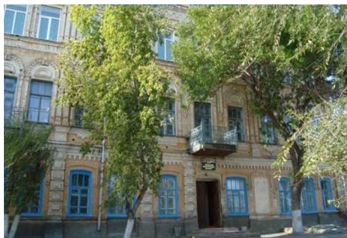
Современный вид здания колледжа

Возглавлял профсоюзную организацию преподавателей и сотрудников колледжа неосвобожденный председатель из числа преподавателей, а профсоюзной организацией студентов руководил освобожденный председатель, также из числа педагогических работников.