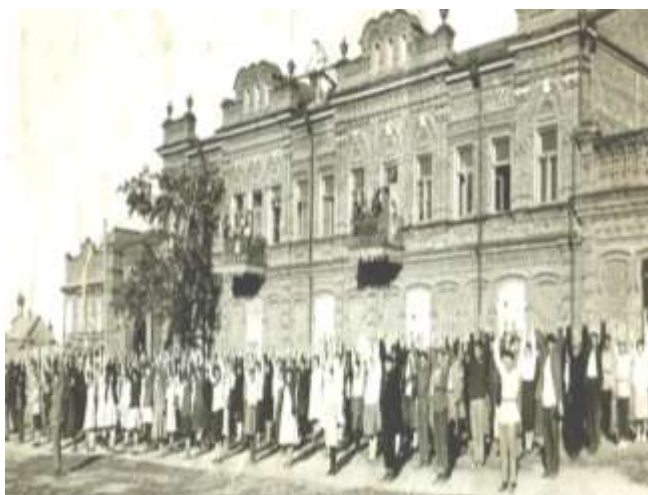
Колледж в 30-е годы (утренняя гимнастика)

Профсоюзная организация Дубовского педагогического колледжа начала свое существование еще в 30-е годы прошлого столетия , и ее история значительна и богата событиями, делами и успехами и в наши дни. Долгие годы профсоюзная организация колледжа представляла собой две взаимосотрудничающие структурные единицы: профсоюзную организацию сотрудников и преподавателей и студенческую профсоюзную организацию.