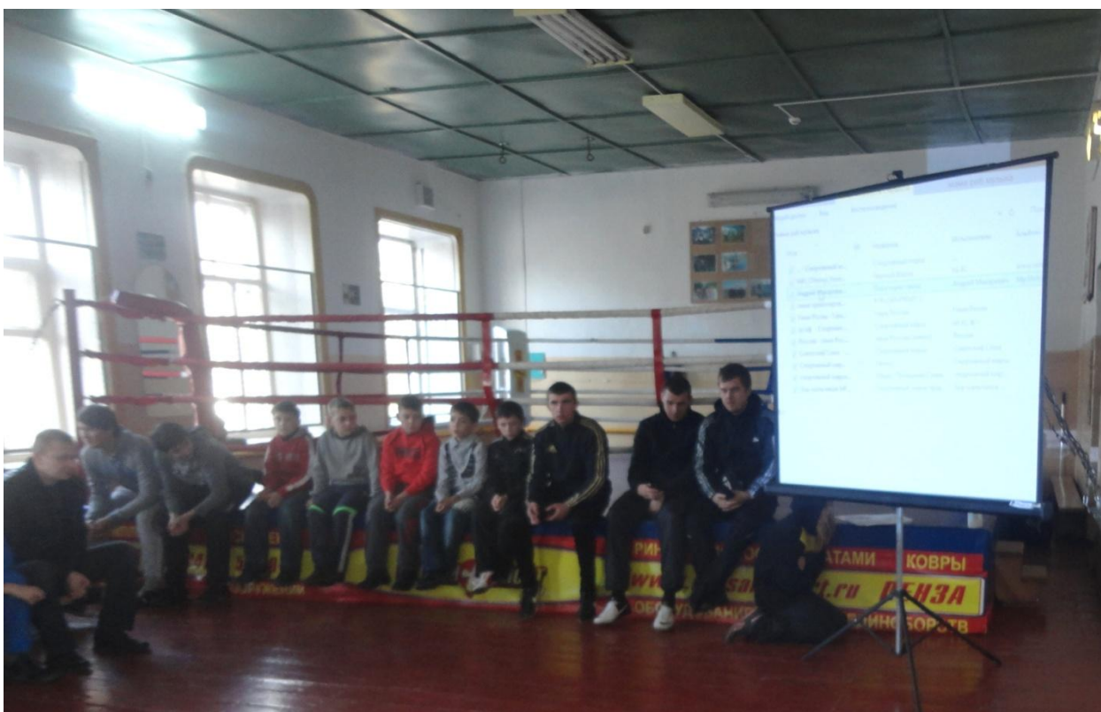
Отделение спортивных единоборств Армспорт