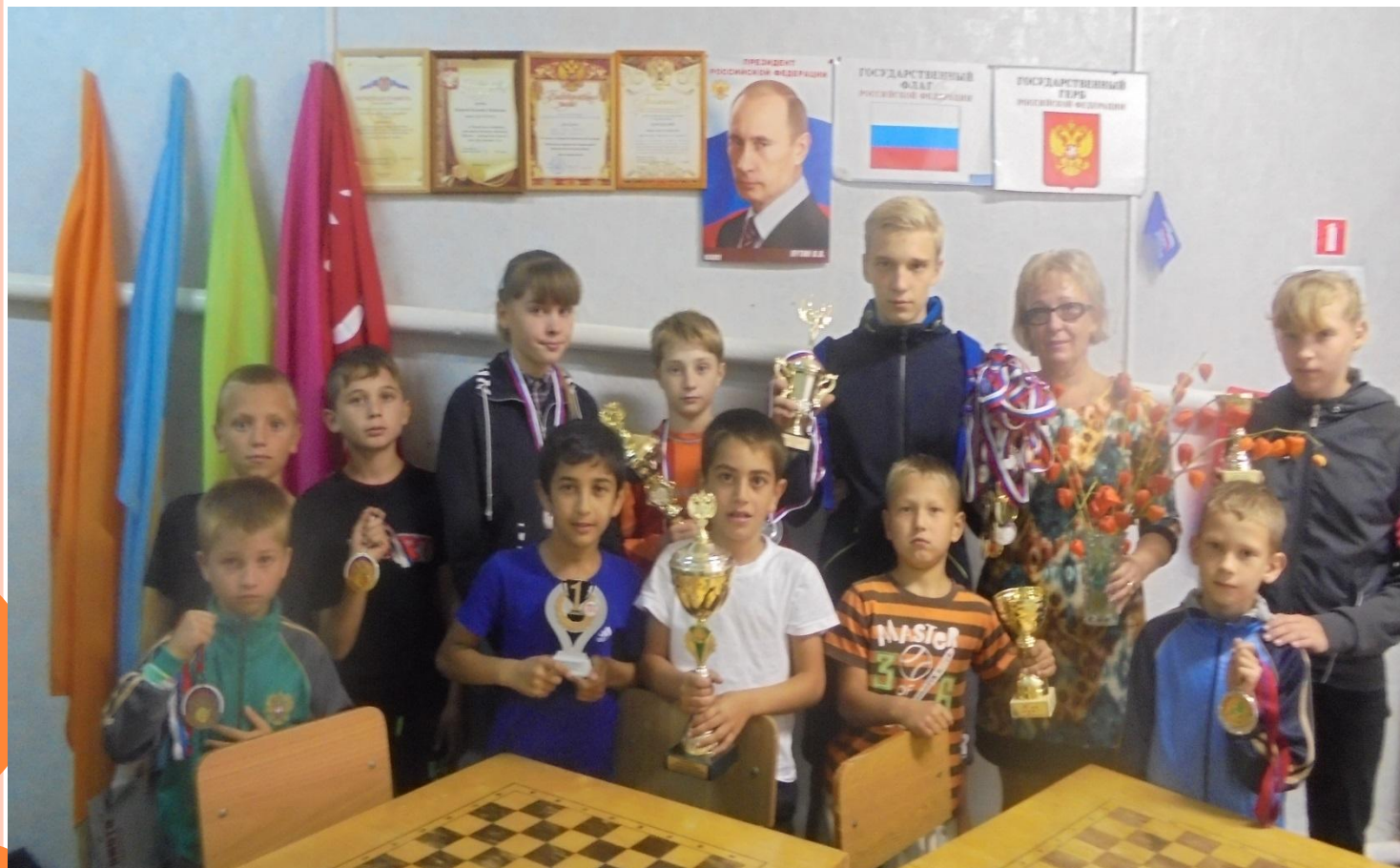
Торжественная линейка посвящения в спортсмены в МКОУ ДОД ДЮСШ Дубовского муниципального района Волгоградской области