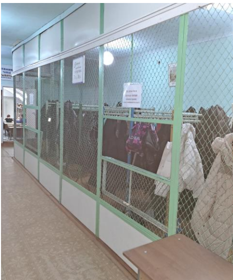
Бытовая комната (гардеробная)

ПРИЛОЖЕНИЕ 17 К АКТУ ОБСЛЕДОВАНИЯ ДОСТУПНОСТИ ДЛЯ ИНВАЛИДОВ ОБЪЕКТА И ПРЕДОСТАВЛЯЕМЫХ НА НЕМ УСЛУГ В СФЕРЕ ОБРАЗОВАНИЯ